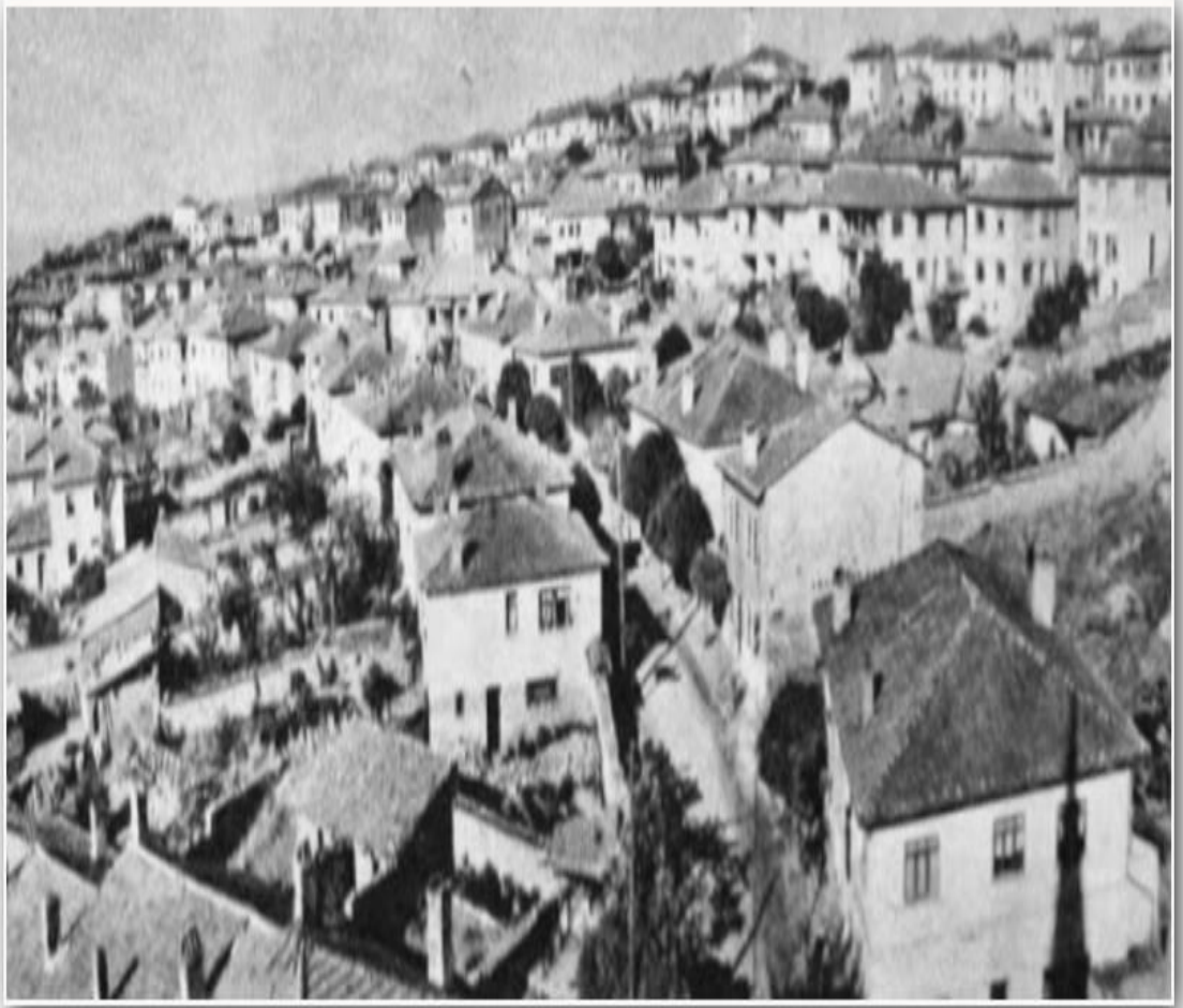
Ek 7- http://www.oguztopoglu.com . Felaket sonrasında Demirci'ye yapılan evlerin bir kısmı.