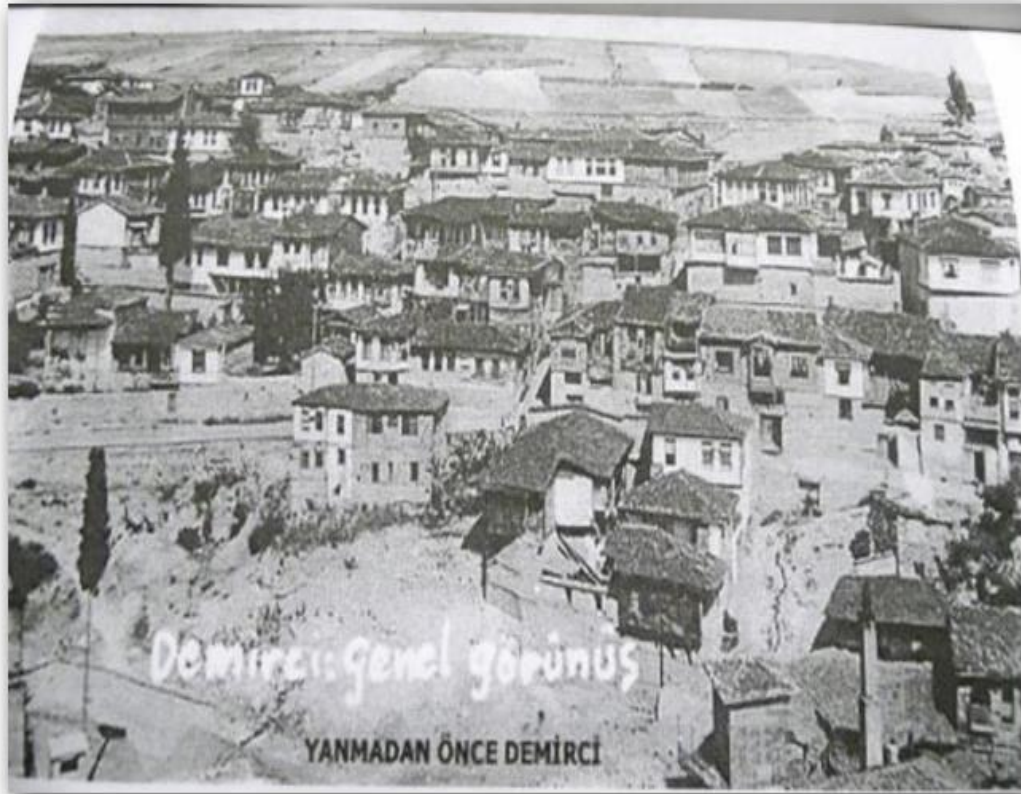
Ek 6- http://www.demircirehberi.com . Yangından önce ve sonra Demirci.