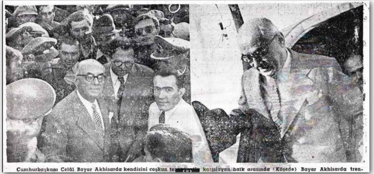
Ek 3- Cumhuriyet, 31 Ağustos 1950: 1; Milliyet, 31.08.1950: 1. Cumhurbaşkanı Celal Bayar uçaktan inerken.