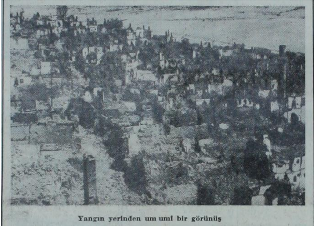
Ek 5- Yeni İstanbul, 27 Ağustos 1950: 3. Yangın yerinden görünüm.