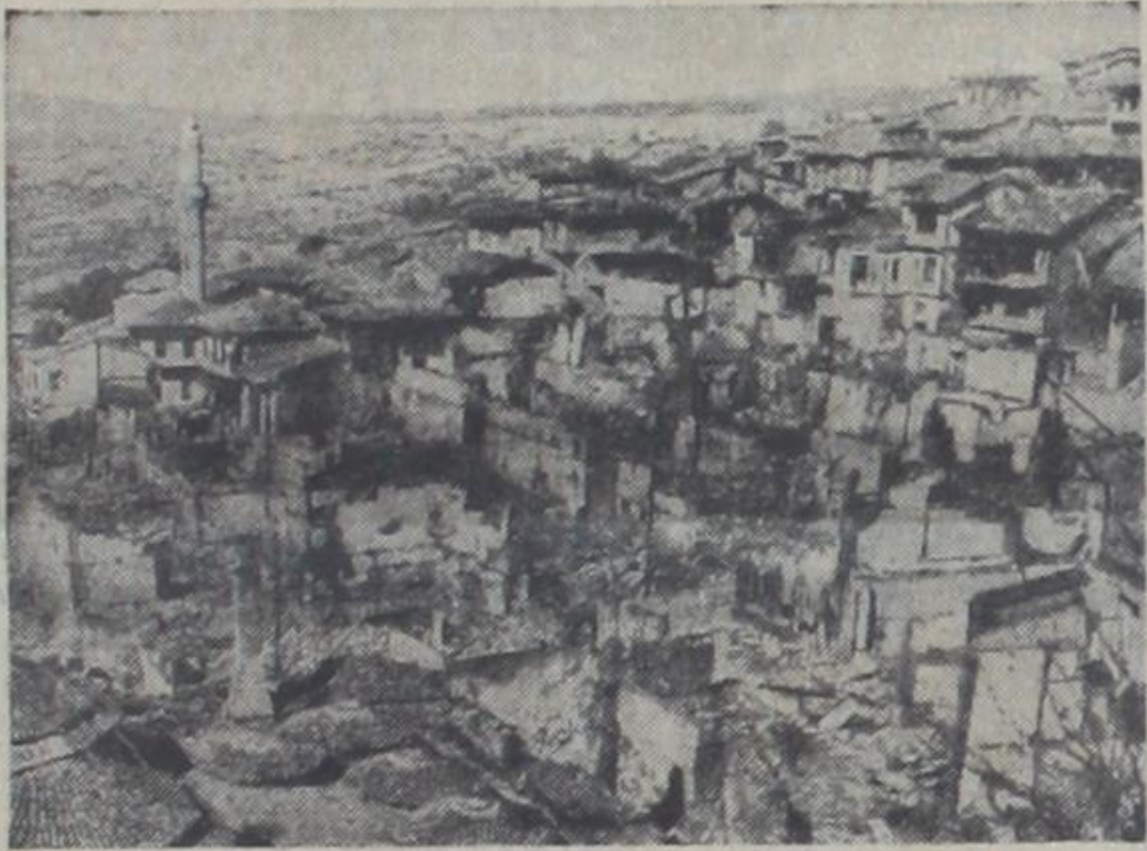
Demircide yangın neticesinde harab olan sahanın görünüşü (Yazısı üçüncü sahifemizde)

İç İşleri Bakanı, çalışmalar ve felâketzedelere yapılan yardımlar hakkında izahat veriyor