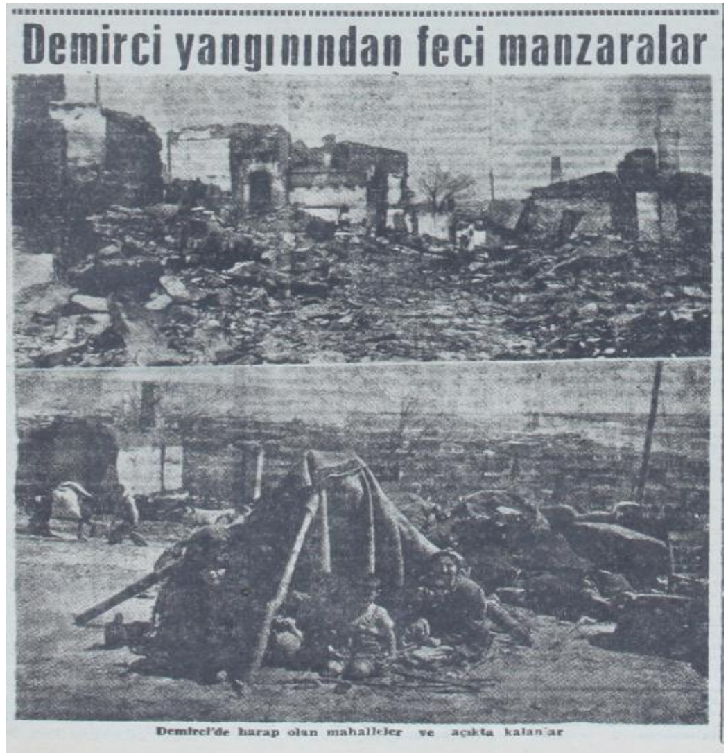
Ek 1- Akşam, 30 Ağustos 1950: 5. Yangın sonrası Demirci'den görünüm.